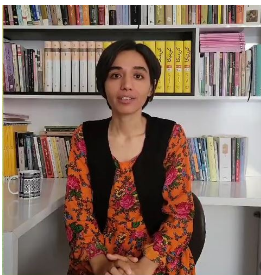
Zara'da video açıklama

Em spasiya Zara dikin ku ji bo pîrozbahîya me ya 3-ê Kanûna Pêşîn, 2023-an daxuyaniyeke kesane ya berfireh ji me re şandiye.